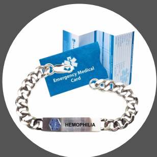
Entrega de brazaletes médicos para pacientes

"En la Asociación Puertorriqueña de Hemofilia y Condiciones de Sangrado educamos a nuestras familias para que sean nuestros portavoces desde su experiencia. Nuestros programas de educación, liderazgo y abogacía como: Alza tu Voz, #DeRojoPorlaHemofilia, LiderHEMOS, Día de Abogacía, AcampHemos y otras iniciativas, permiten a nuestra población educarse y buscar mejores oportunidades que atiendan sus necesidades"