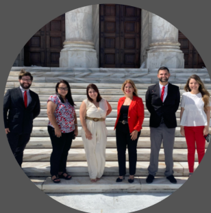
"Alza tu Voz" desarrolla liderazgo y destrezas de abogacía.