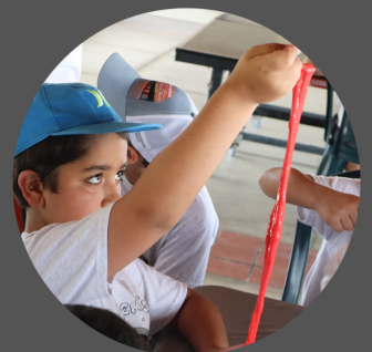
AcampHemos: campamento adaptado para niños